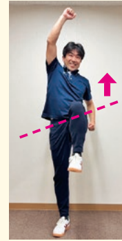
上げていた脚と腕を入れ替えます。