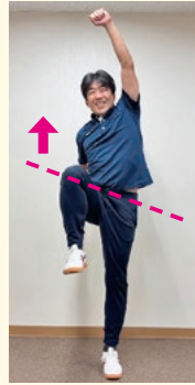
片方の脚を上げ、反対側の腕を天井方向に上げます。