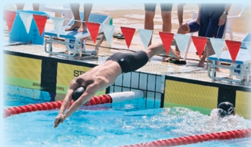
男子30代200mメドレーリレー