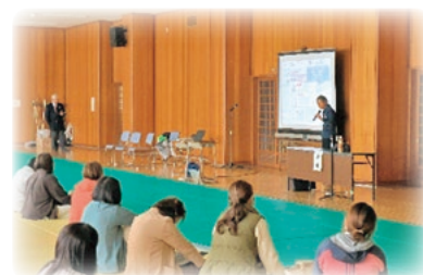
母集団講習会の様子

*優良団員…団員として少年団活動とともに、日常生活においても模範となるような活動をされている6年生以上の団員のこと