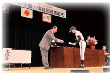
優良団員表彰式の様子

地域の皆様、子供たちの活動を、温かく見守っていただきますようよろしくお願いいたします。